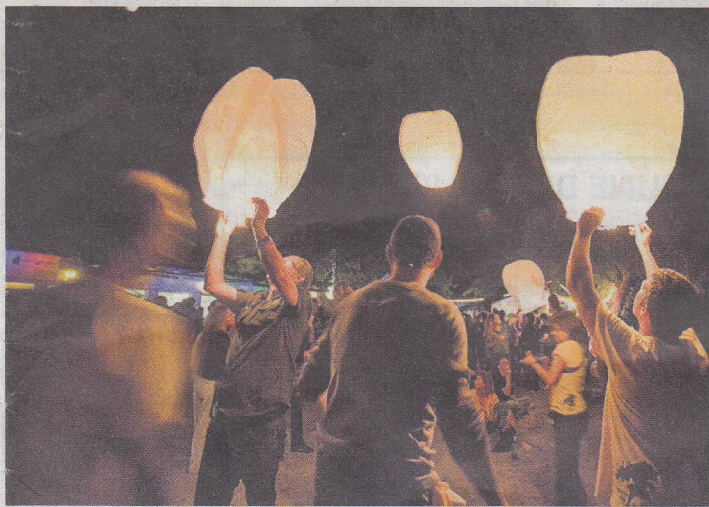
Lâcher de montgolfières chinoises afin de célébrer les 10 ans de l'association.