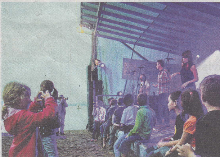
Un festival qui se vit aussi en famille! Début de soirée samedi. En concert: Party Project.